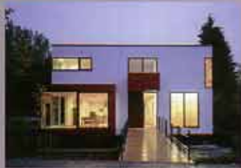
fabi architekten bda

glockengasse 10 d-93047 regensburg tel. +49(0)941-900333 e-mail: mail@fabi-architekten.de website: www.fabi-architekten.de gegründet: 1996