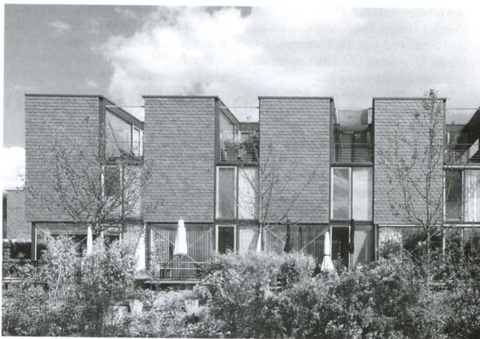
Fotos auf dieser Seite: Baugemeinschaft für 24 Reihenhäuser in München-Riem (Architekt Ingo Bucher-Beholz, Projektentwicklung Theo Peter mit Bauzeit-Netzwerk), Deutscher Holzbaupreis 2011

Das erste, baureife Projekt, das „Haus mit Zukunft“ soll nächstes Jahr im Re-