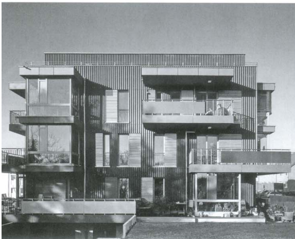
Gestapelte Häuser in Low-Budget-Bauweise: Genossenschaftliches Wohnhaus für sechs Familien in Frankfurt-Preungesheim (bb22 architekten) Foto: Christoph Kraneburg

Abbildung aus: Christoph Gunßer, Theo Peter: miteinander bauen. Architektur für gute Nachbarschaften. Baugruppen | Baugenossenschaften, Deutsche Verlagsanstalt, München 2010