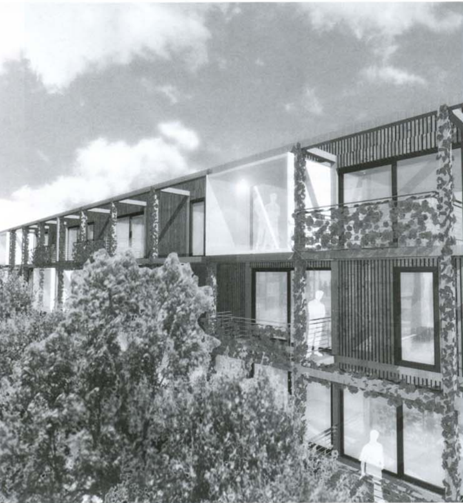
Perspektivische Ansicht (oben) und Detail (rechts) der zukünftigen Bebauung in Burgweinting (Planung fabi architekten bda / Stephan Fabi, Regensburg)

Bauen in Genossenschaft als Reaktion auf den demografischen Wandel