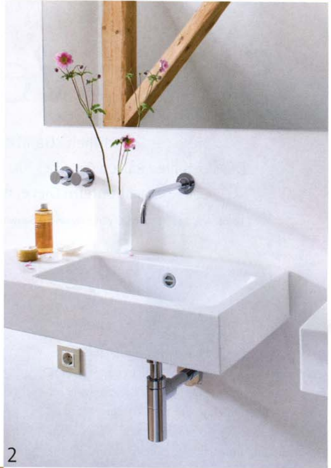
2 DIE WASCHTISCHE aus Stahlemail (Alape) haben eine seitliche Ablage, die weitere Stellflächen ersetzt. Auch die Wandarmaturen (Vola) geben sich zurückhaltend. Schönes Detail: die Regler über der Ablage am Becken.