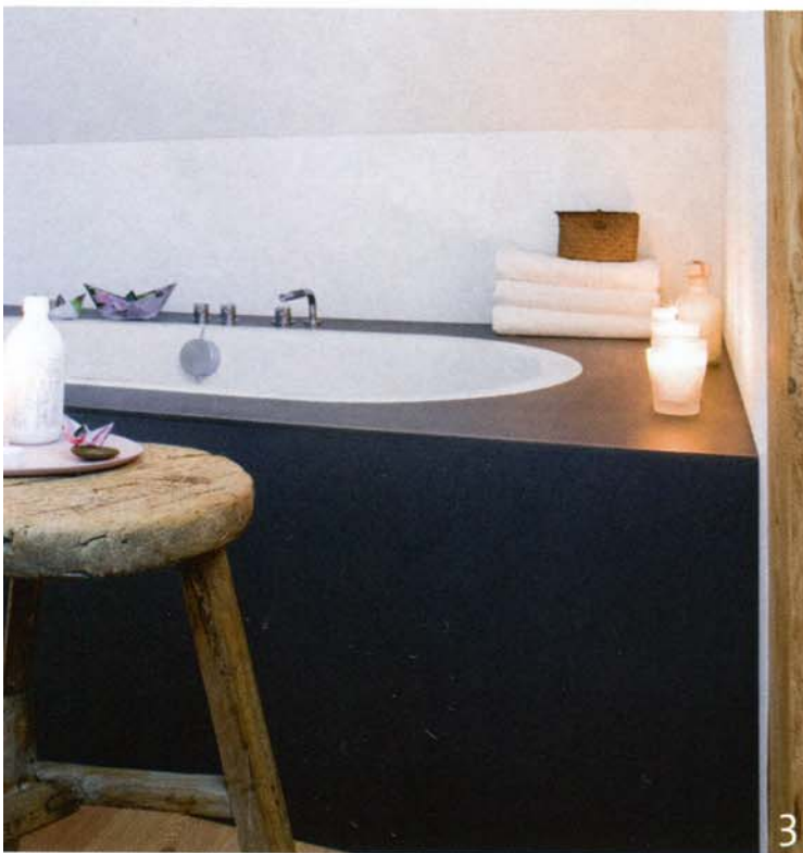
3 KERZENSCHNITT und zarter Duft machen jedes Wannenbad zum intensiven Spa-Erlebnis. Auf dem Sockel steht alles, was schnell zur Hand sein soll. Rustikales Pendant zu den Holzbalken: der alte Schemel.