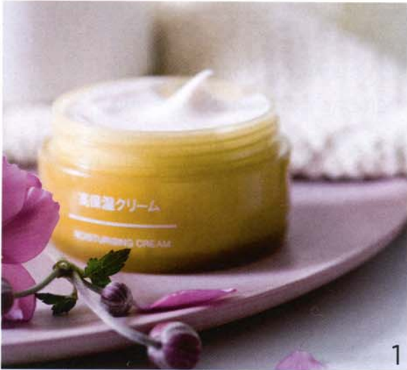
1 VERWÖHNPROGRAMM für einen guten Start in den Tag: pflegende Cremes und ein ruhiges Ambiente.